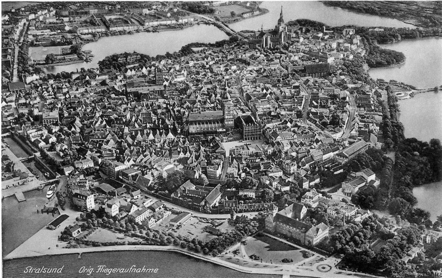
Stralsunder Altstadt mit Wallanlagen, Postkarte um 1935

Sonnabend, 24. September 2022 | 10.00 Uhr