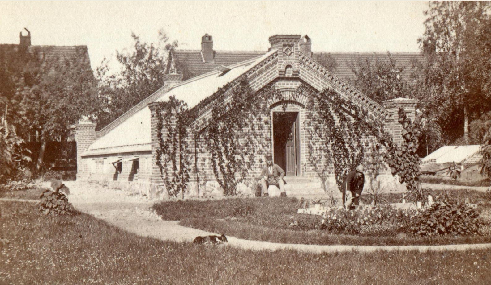
Gewächshaus in Eldena, 1863