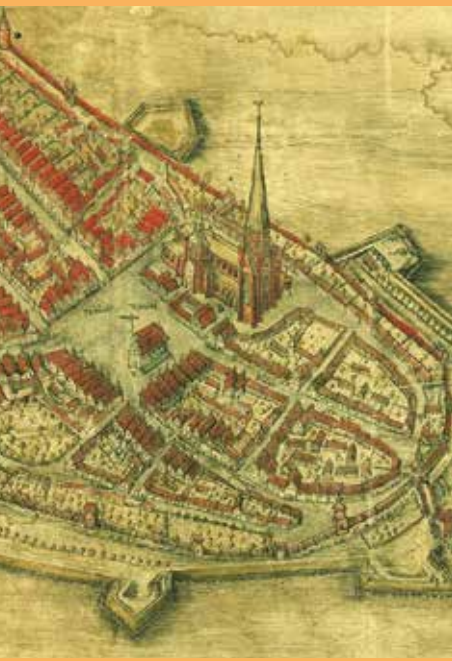
Ausschnitt Stauedeplan 1647