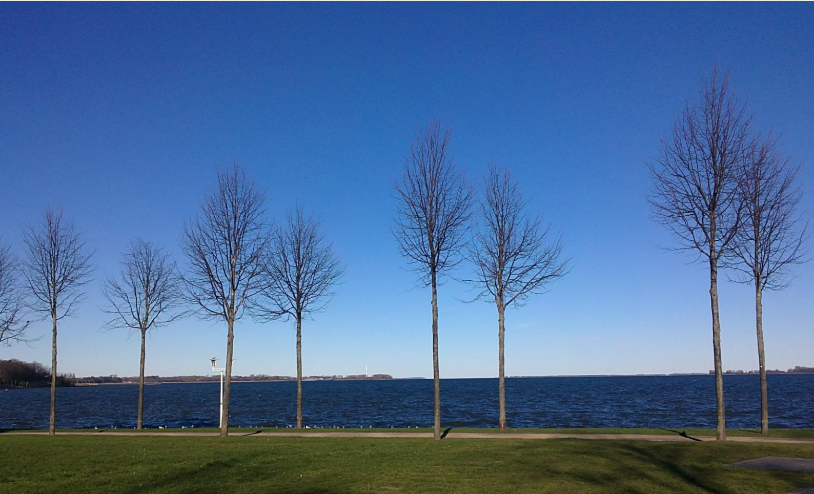
Lindenallee an der Sundpromenade, Foto: Angela Pfennig, 2015

Sonnabend, 10. September 2016 | 10.00 Uhr