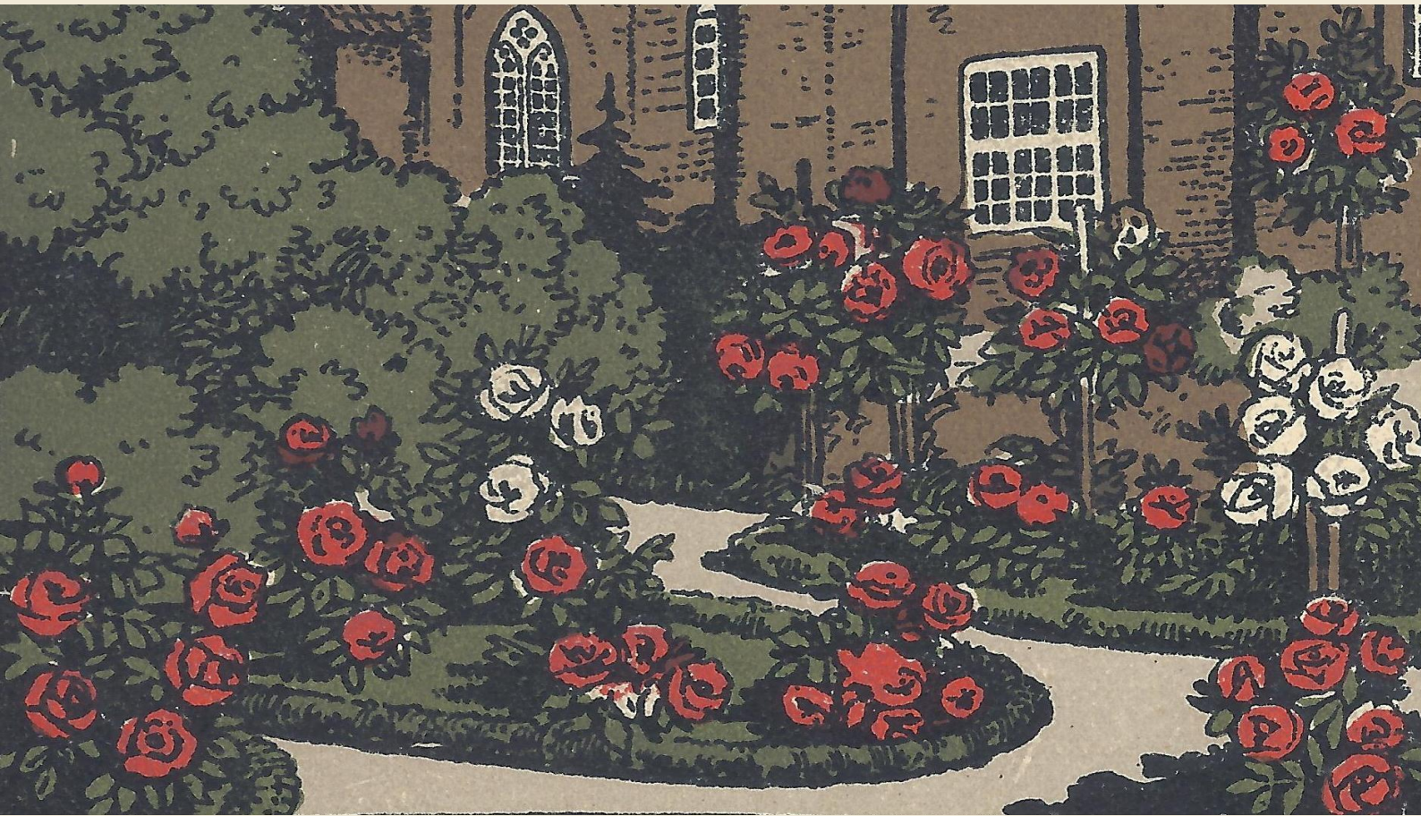
Rosengarten im Johanniskloster, Künstler-Stein-Zeichnung (Detail)

Sonnabend, 3. September 2016 | 10.00 Uhr