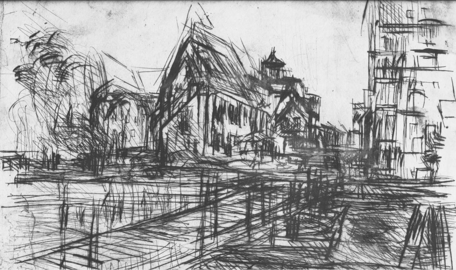
Ansicht Stralsund, Radierung von Matthias Jaeger, 1973

Ein Spaziergang durch die Jahresringe der Hansestadt Stralsund unter stadt- und freiraumplanerischen Gesichtspunkten