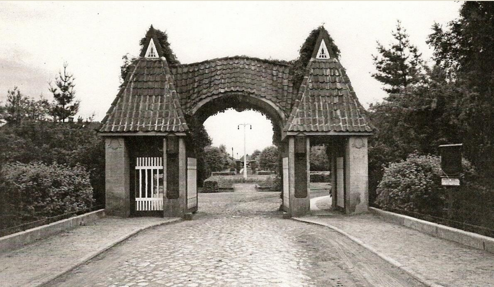
Eingangsportal Provinzialheilanstalt Stralsund, um 1925, Archiv Hansekllinikum