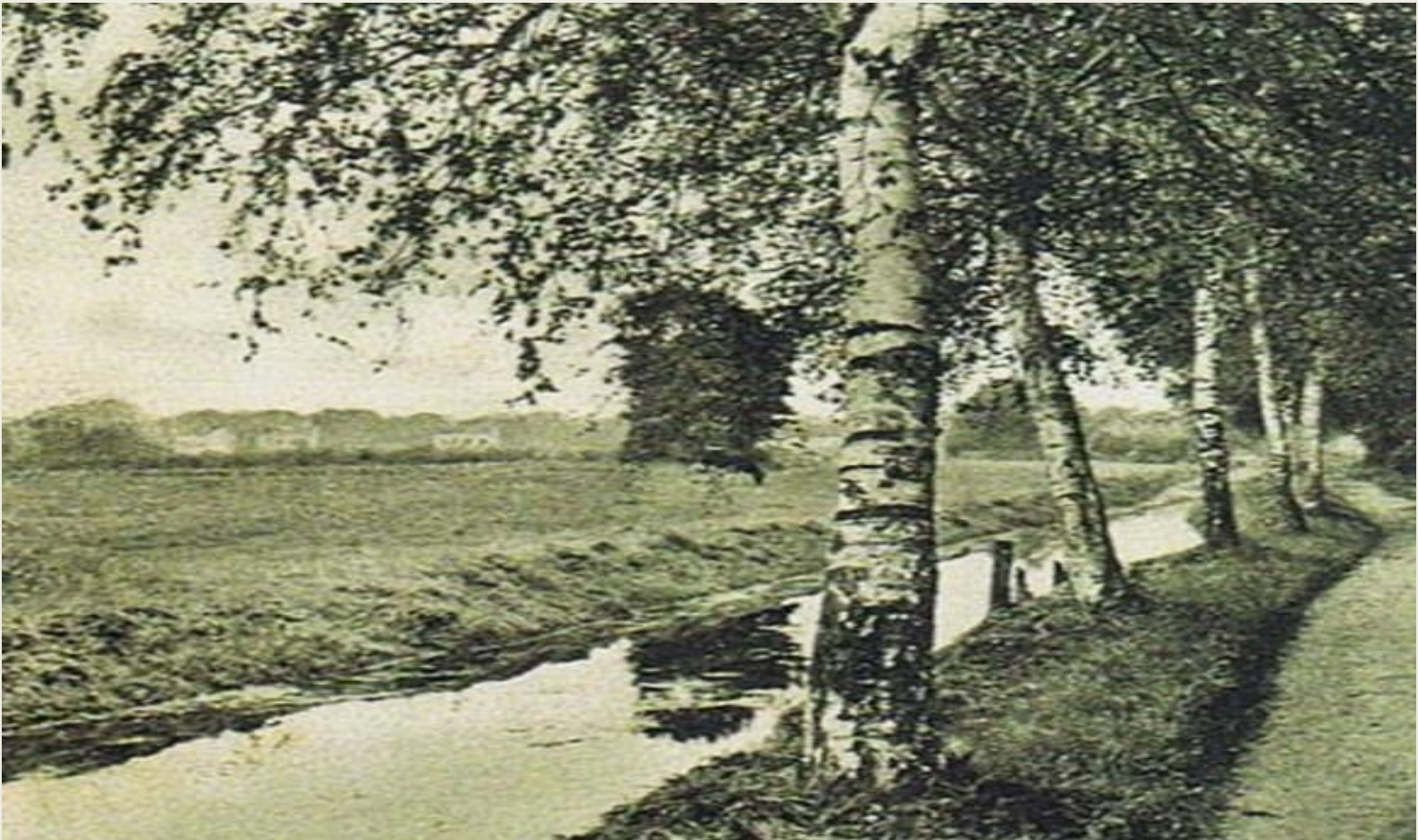
Birkenweg und Mühlengraben, um 1910

Sonnabend, 28. Februar 2015 | 10.00 Uhr Treffpunkt: Moorteichbrücke | Friedrich-Engels-Straße