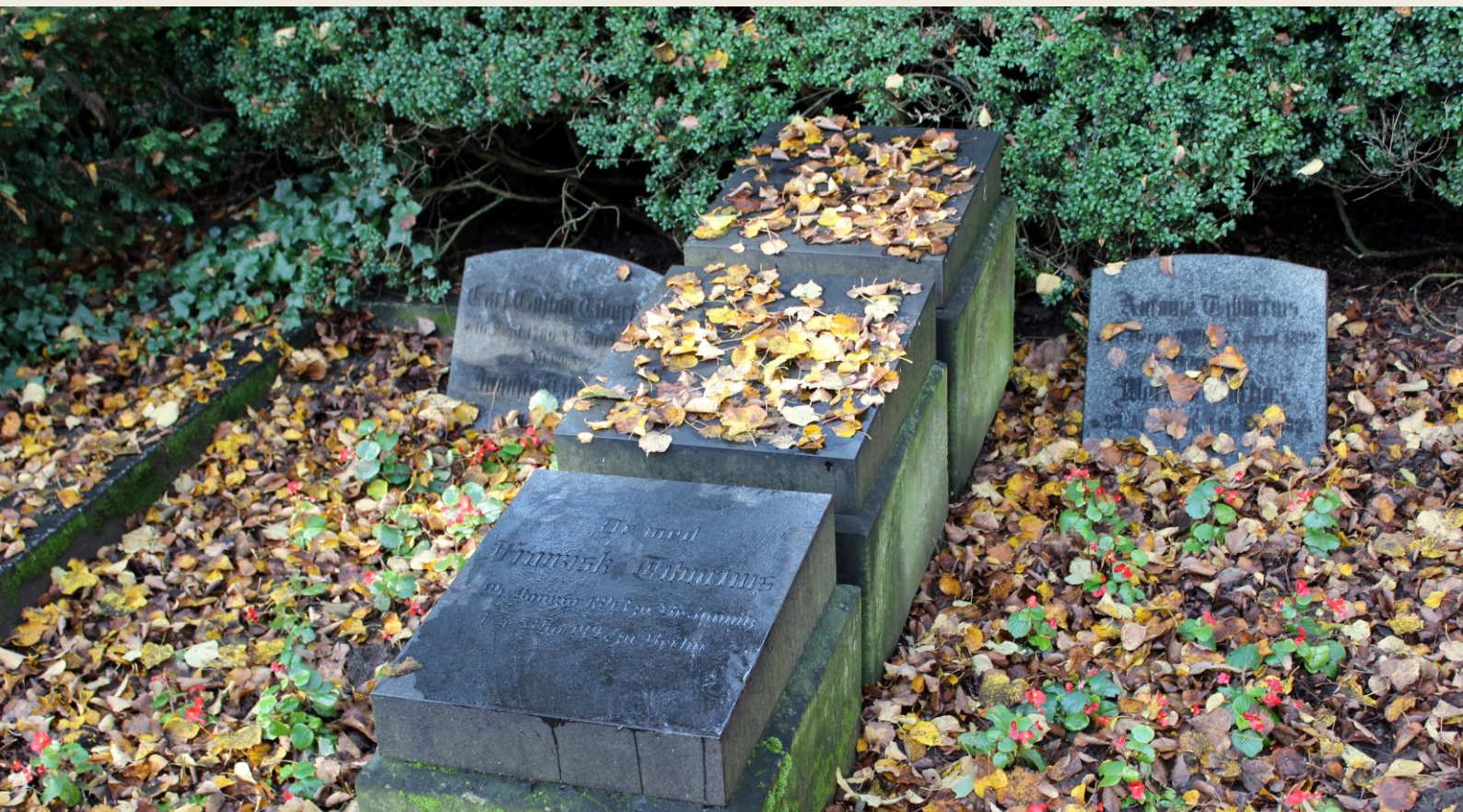
Grabstätte Franziska Tiburtius auf dem St.-Jürgen-Friedhof