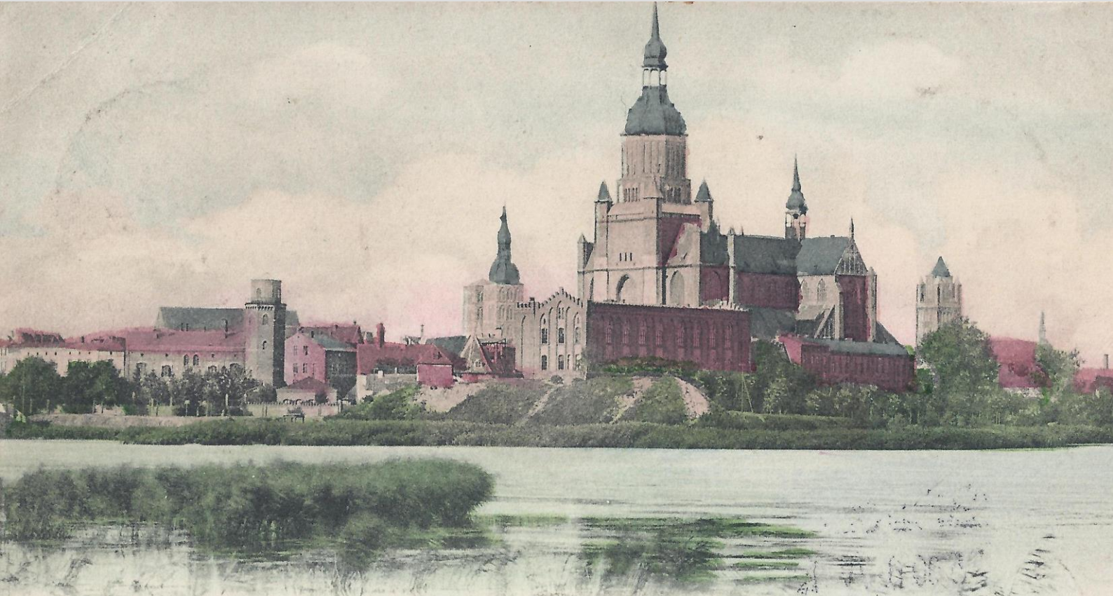
Mühlenbastion, Postkarte um 1900

Terminänderung: Diese Führung wurde vom 11.4. auf den 18.4.15 verlegt