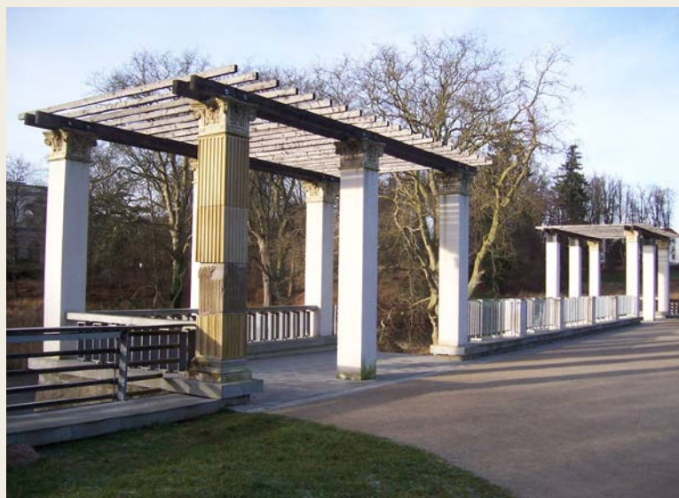
Park Putbus, Schlossterrasse: Historische Postkarte, um 1900 | Foto: André Wittkamp, um 2010

Sonnabend, 21. September 2013 | 10.00 Uhr