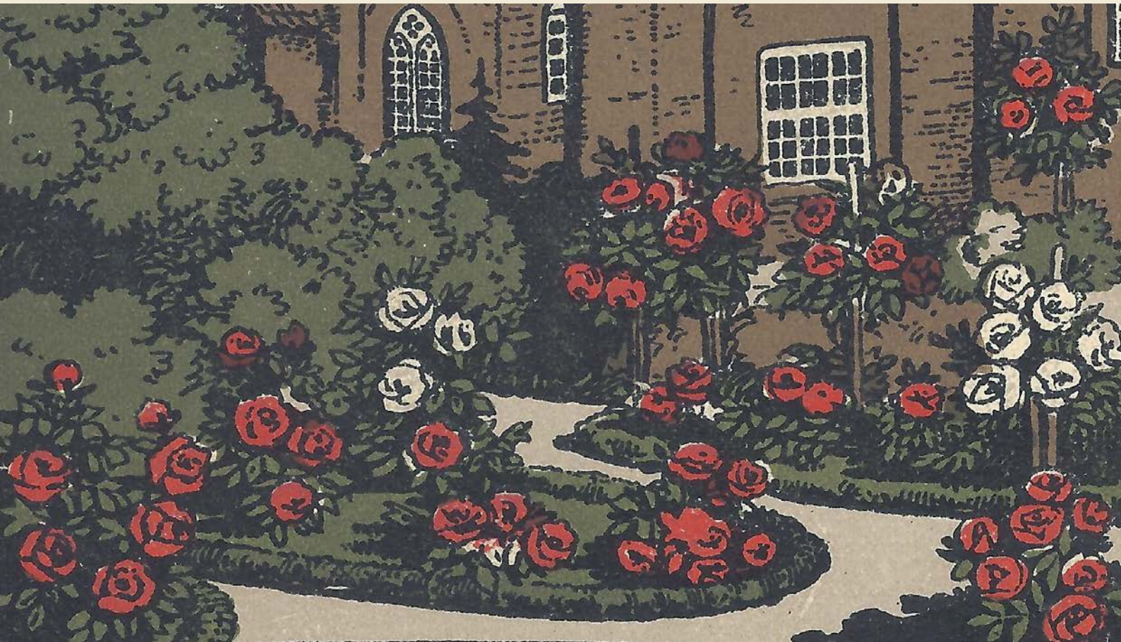
Rosengarten im Johanniskloster, Künstler-Stein-Zeichnung (Detail)