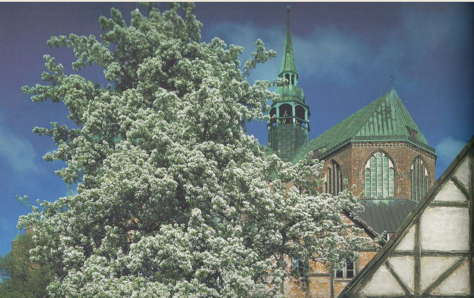
Birnbäum in Marienquartier