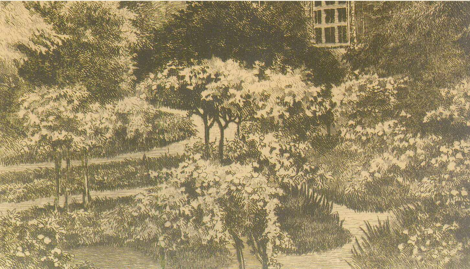
Rosengarten im Johanniskloster, Radierung von A. Junck (Detail)