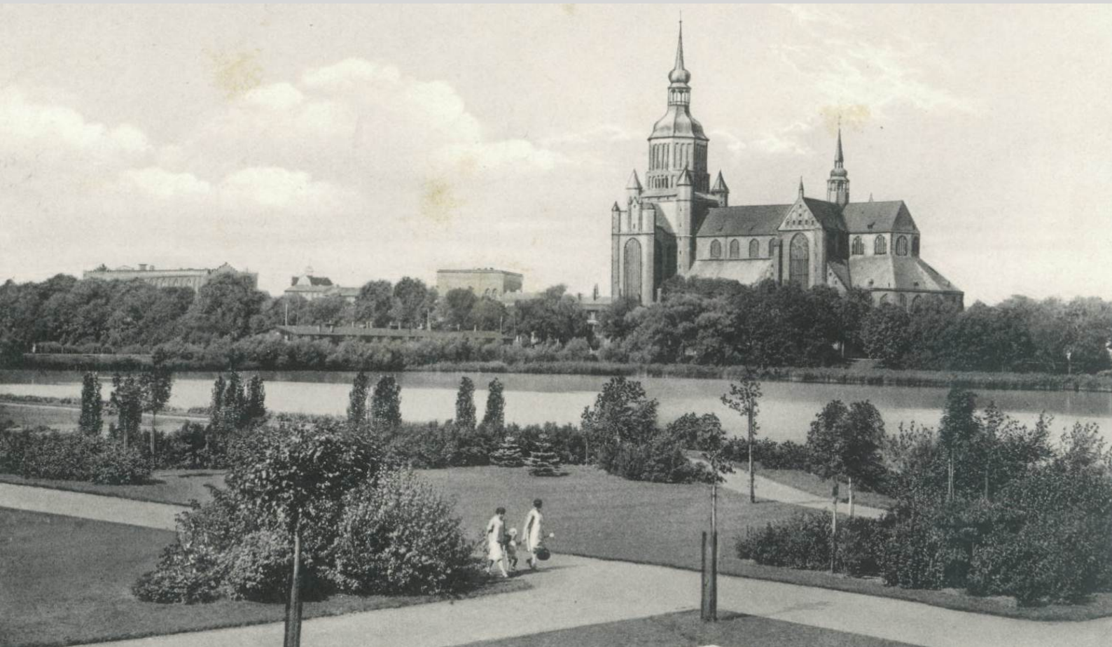
Anlagen am Wulflamufer, Postkarte, um 1935

Sonnabend, 27. April 2013 | 10.00 Uhr Treffpunkt: Lambert-Steinwich-Denkmal