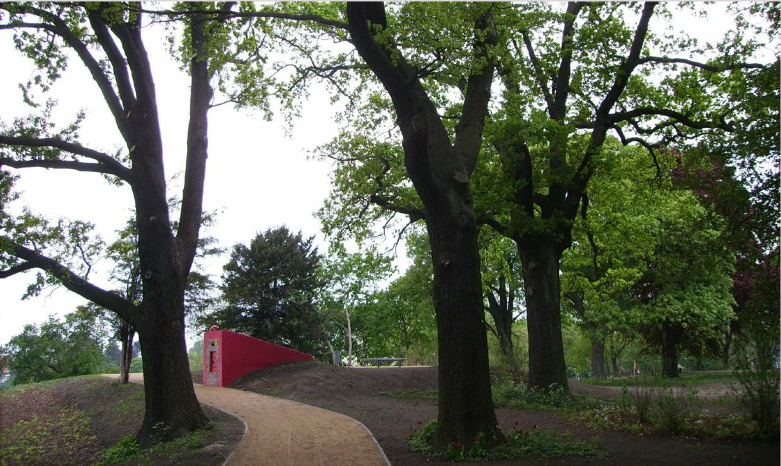
Hospitaler Bastion