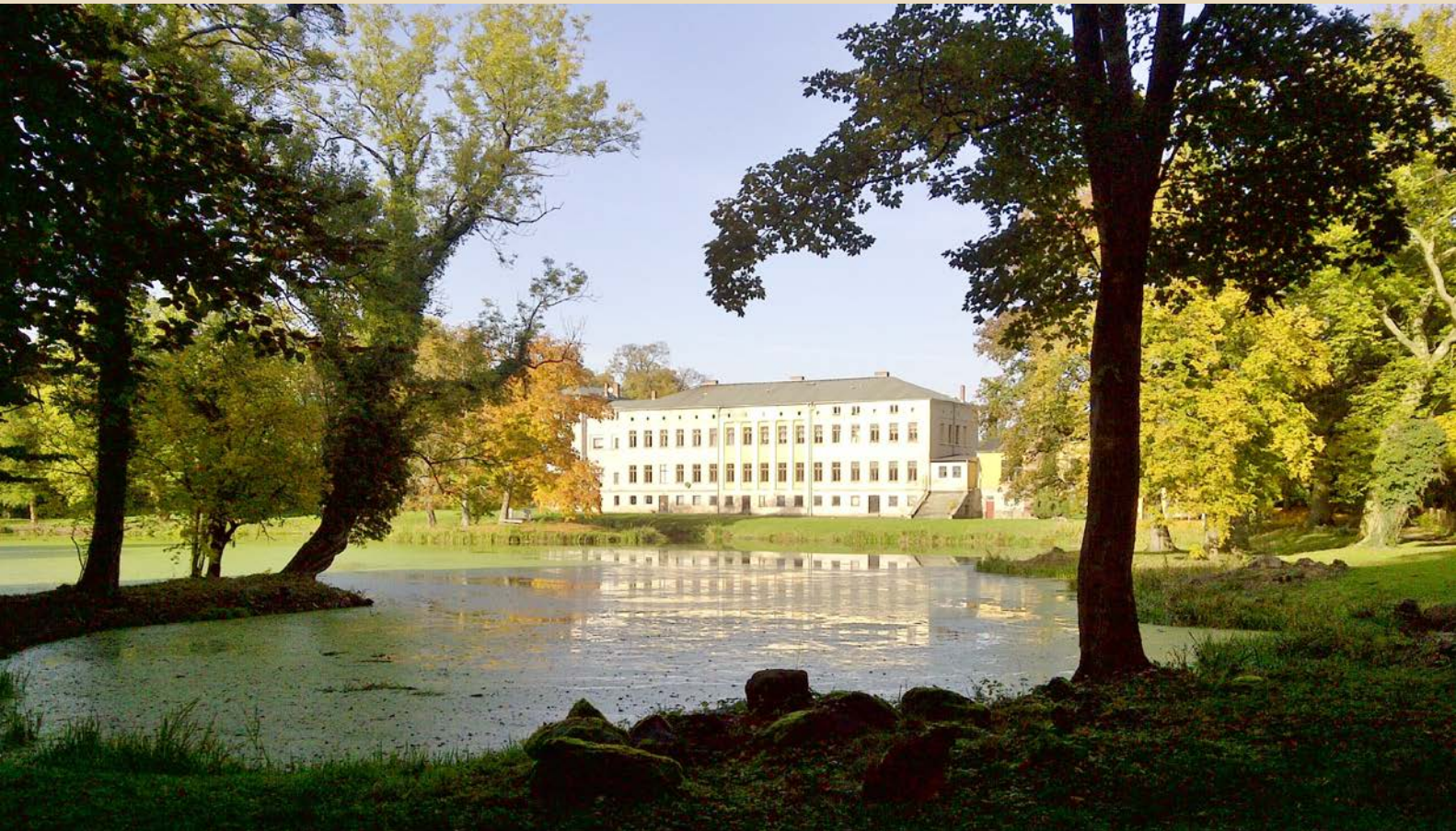
Landschaftspark Semlow und Herrenhaus, Foto: Mario Müller, 2012

Sonnabend, 23. Februar 2013 | 10.00 Uhr Treffpunkt: Herrenhaus Semlow