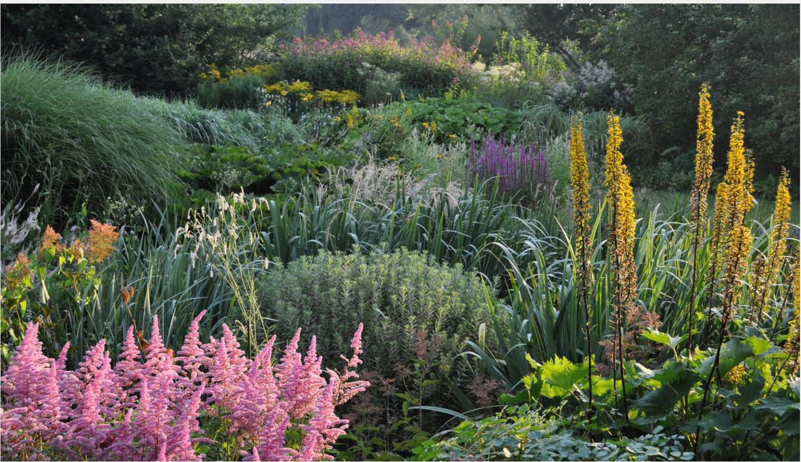
Wildstaudengarten in Groß Potrems, Foto: Wegner

Sonnabend, 11. Juli 2015 | 10.00 Uhr Treffpunkt: 18196 Groß Potrems | Am Dorfteich 2