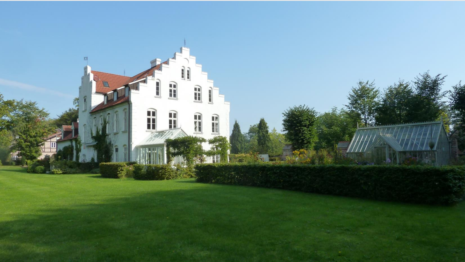
Herrenhaus Streu und Garten