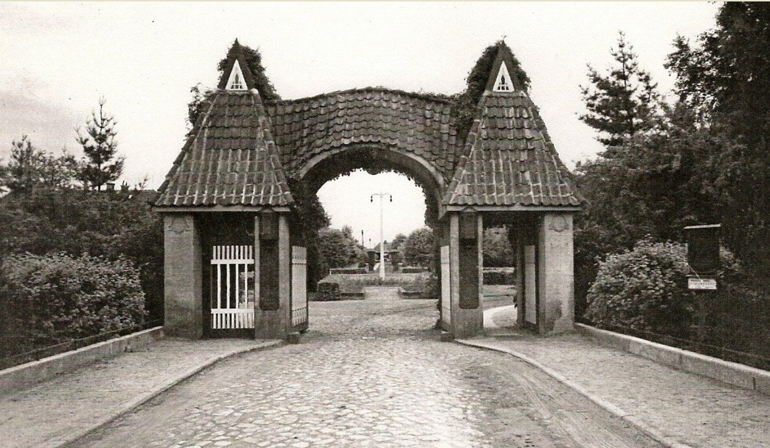
Eingangsportal Provinzialheilanstalt Stralsund, um 1925