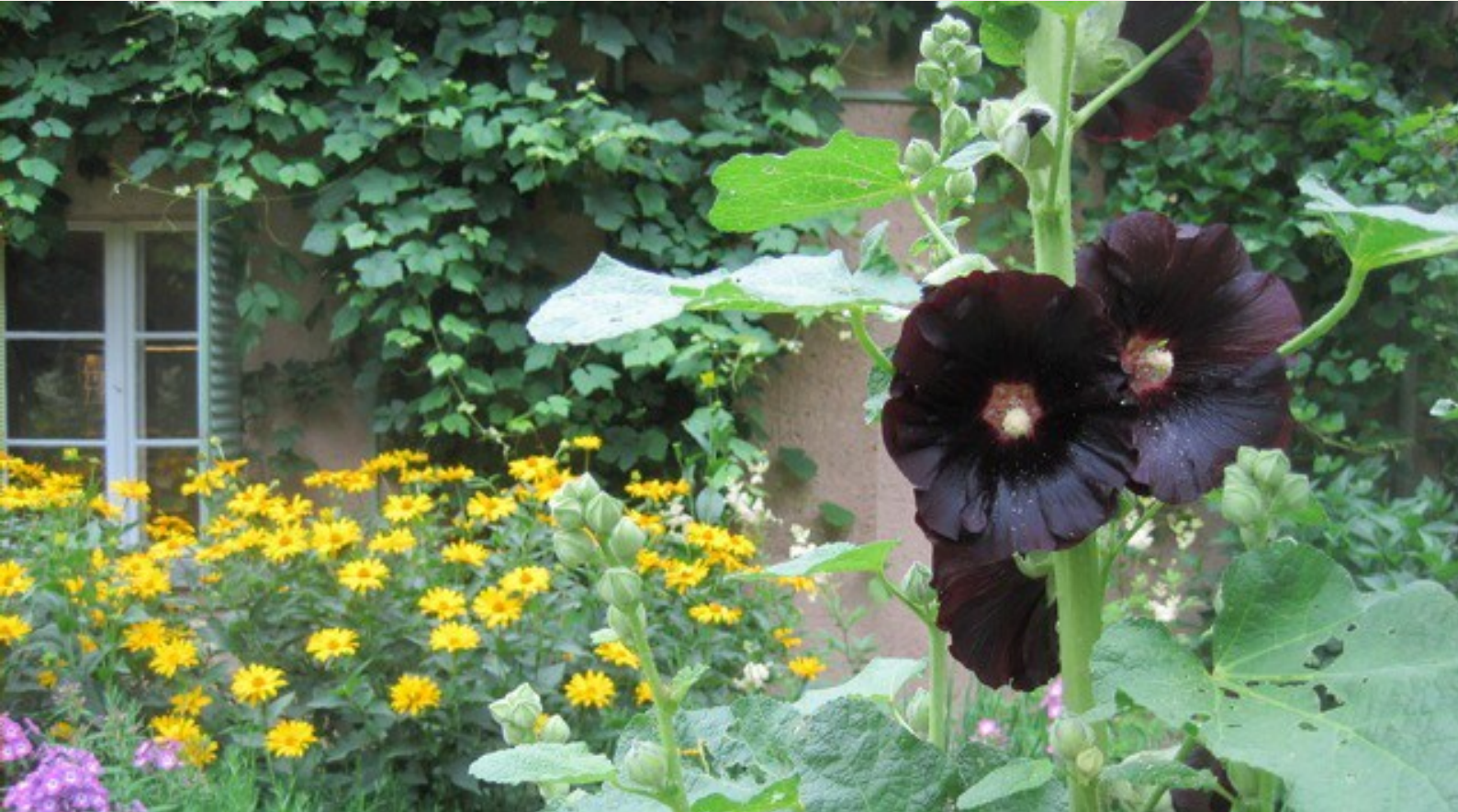
Liebermann-Garten am Wannsee