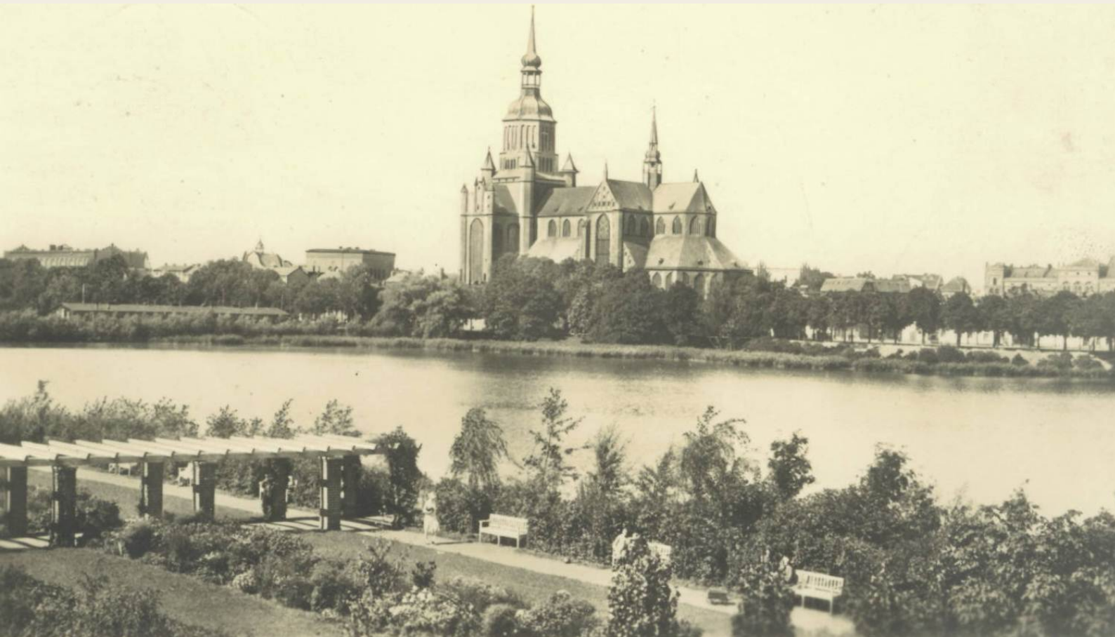
Hans-Lucht-Garten, Postkarte, um 1942

Sonnabend, 15. Juni 2013 | 10.00 Uhr Treffpunkt: Lambert-Steinwich-Denkmal